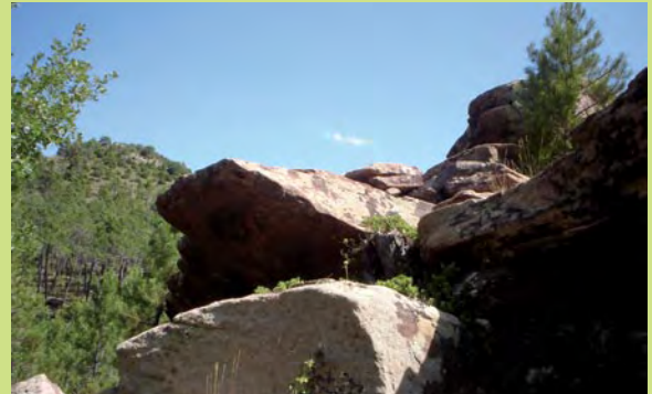
Piedra de rodeno

Dejamos un camino a la derecha y seguimos recto, finalizando el ascenso.