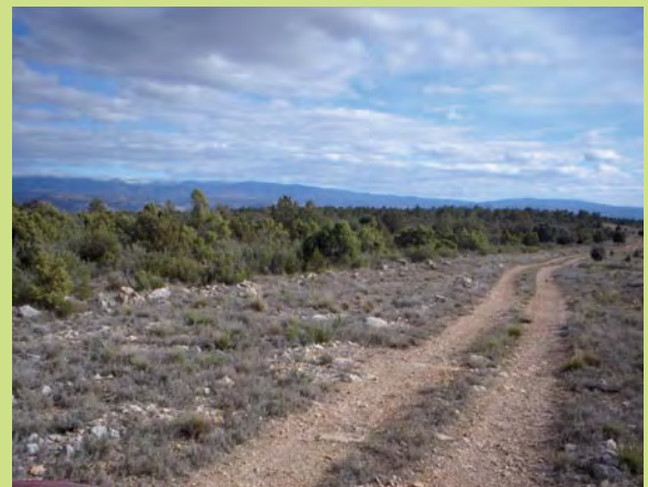
Lomas de Abril