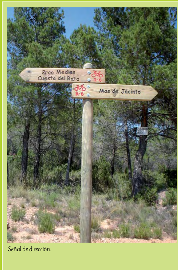
Señal de dirección.

Llegamos a una bifurcación y vamos hacia la izquierda dejando el PR-CV 131.4 a la derecha.